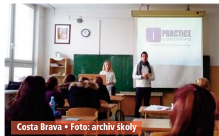
Costa Brava

Integrovaná střední škola Slavkov u Brna, příspěvková organizace si dovoluje pozvat všechny zájemce o studium na naší škole a další veřejnost na Dny otevřených dveří, které proběhnou ve dnech 10. února od 10 do 17 hodin a 11. února od 9 do 12 hodin.