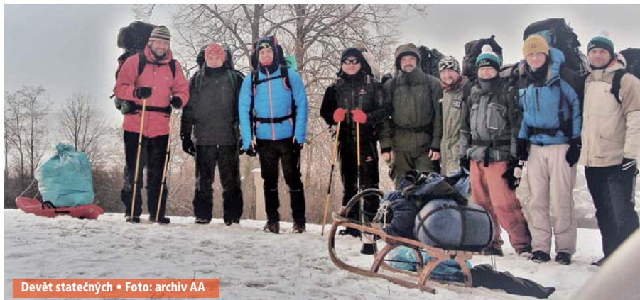
Devět statečných

Závěrem bych chtěl za všechny organizátory poděkovat za účast a budeme se těšit v roce 2017! Jan Šícha