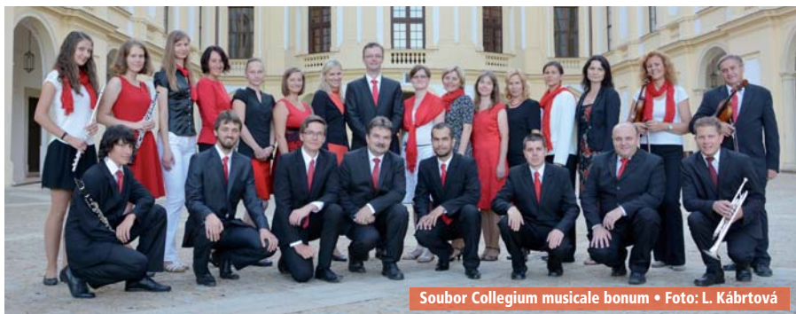
Soubor Collegium musicale bonum •