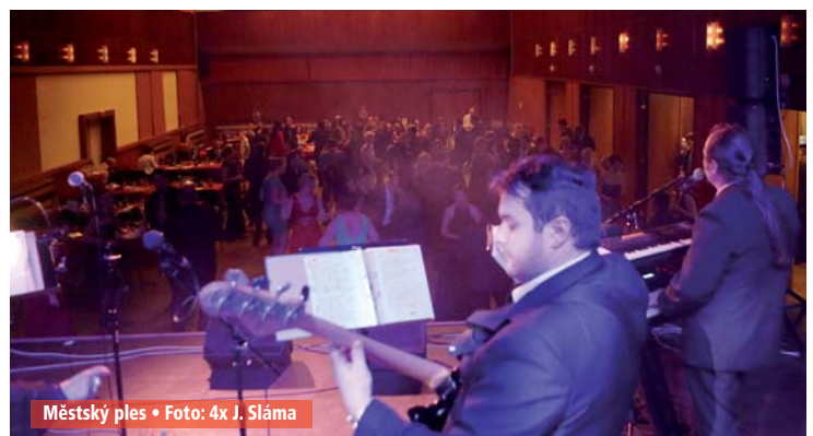
Městský ples • Foto: 4x J. Sláma