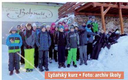
Lyžařský kurz • Foto: archiv školy