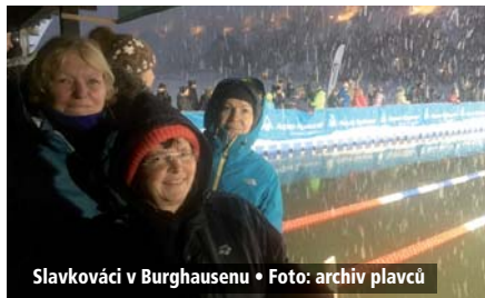
Slavkováci v Burghausenu • Foto: archiv plavců

Ve dnech 5.–8. ledna se do německého Burghausenu sjelo 230 plavců z celého světa, aby změřili síly v ledové vodě. Podle regulí jsou plavci rozděleni od dorostu po 70+ do věkových kategorií po pěti letech. Ne všechny kategorie bývají plně obsazeny, zvláště starší ročníky mají větší šance na medaile nebo dobré umístění.