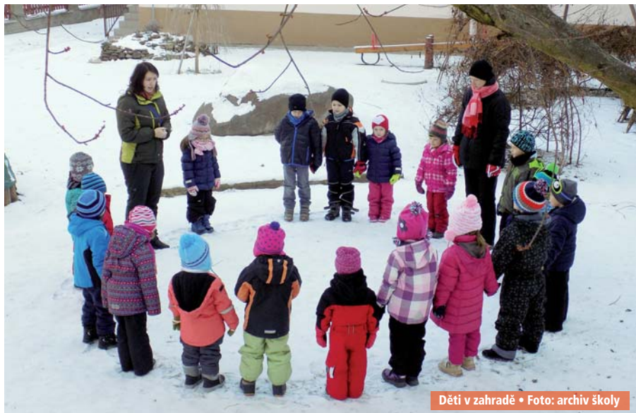
Děti v zahradě

S láskou vzpomínají manžel a synové Michal a Aleš.