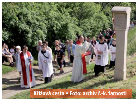
Křížová cesta

Rozvinula se přednášková činnost . V rámci