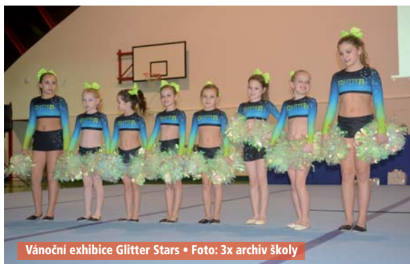
Vánoční exhibice Glitter Stars • Foto: 3x archiv školy