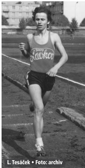
L. Tesáček