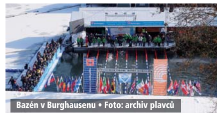
Bazén v Burghausenu