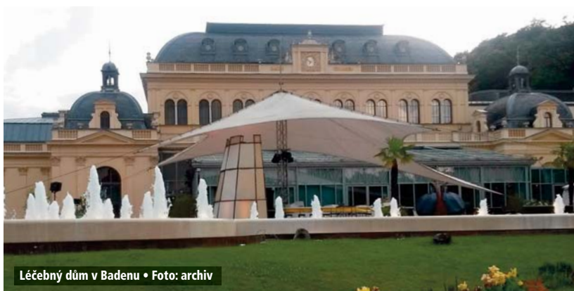
Léčebný dům v Badenu