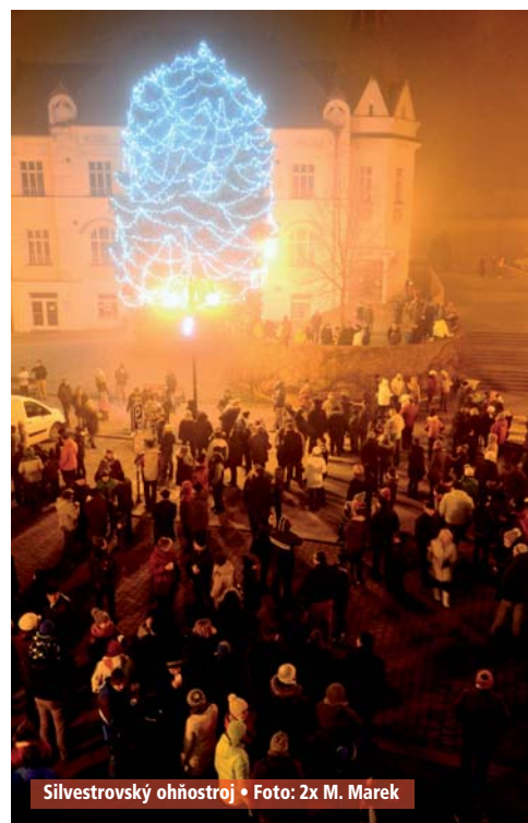
Silvestrovský ohňostroj