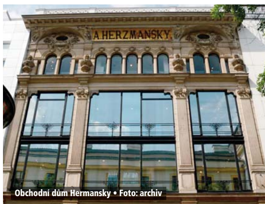
Obchodní dům Hermansky