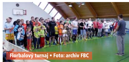
Florbalový turnaj