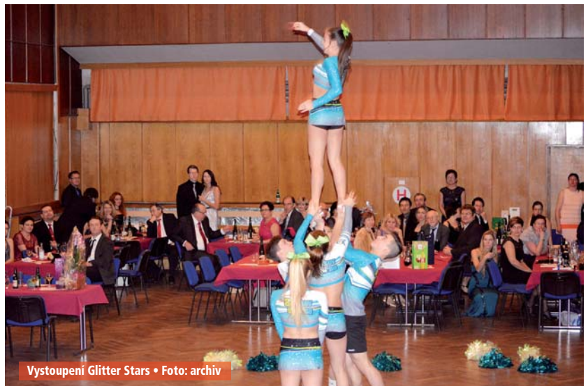
Vystoupení Glitter Stars