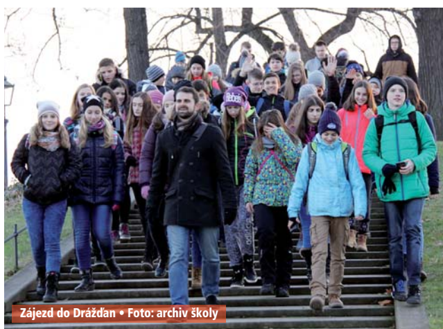
Zájezd do Drážďan

Večer jsme promrzli a unavení z celodenního chození rádi nasedli do vyhřátého autobusu a těšili se domů.