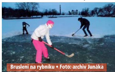
Bruslení na rybníku

Kdo zná populární televizní pořad Partička, dokáže si představit, jak se lze pobavit s využitím jednoho z jeho námětů. My jsme zvolili „detektor lži“ a soutěžní skupiny musely s improvizací zazpívat známou písničku „My tři králové jdeme k vám“.