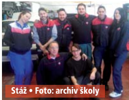
Stáž • Foto: archiv školy

Jako žáci naší školy jsme byli vybráni k absolvování čtyřtýdenního vzdělávací stáže pro automechaniky. Z vídeňského letiště jsme se přemístili do slunné Malagy, kde nás čekal náš tutor Chosé, který nás odvezl do malebného městečka Martos. Každé ráno jsme vyráželi na dopolední praxi, na které jsme byli do 13. hodiny, a poté následovala do 17. hodiny siesta, kterou jsme většinou trávili obědem a koukáním po městě. Město bylo v tuhle dobu jako mrtvé, rolety zatažené, obchody zavřené a z hlučných ulic se jako nějakým kouzlem