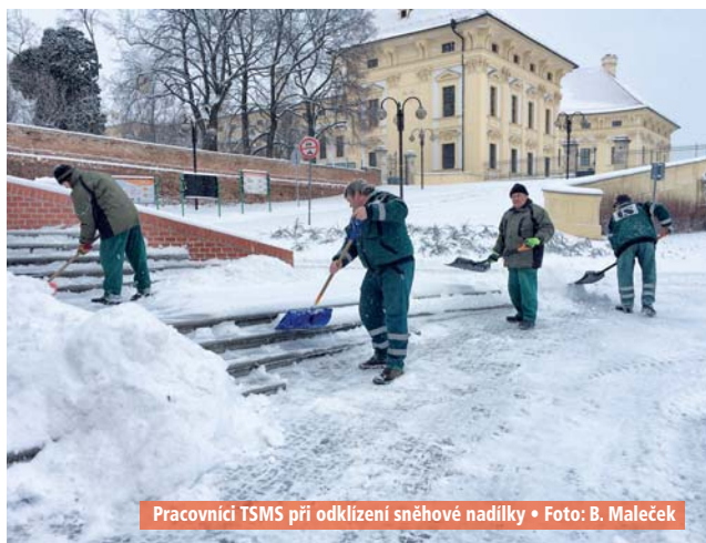
Pracovníci TSMS při odklizení sněhové nadičky • Foto: B. Maleček