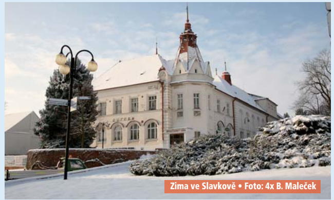
Zima ve Slavkově