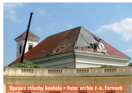
Oprava střechy kostela

Opravy, ekonomika: Ve Slavkově se podařilo dokončení opravy střechy kostela Vzkříšení Páně včetně restaurování dvou bočních schodišť a restaurování mříží v kostele na Špitálce ve výši 2 232 777 Kč. Mimo tyto akce jsme ze stavebních věcí provedli opravu šikmých svodů střechy portiku farního kostela, opatření proti