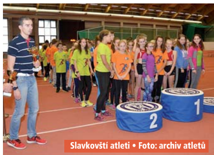
Slavkovští atleti