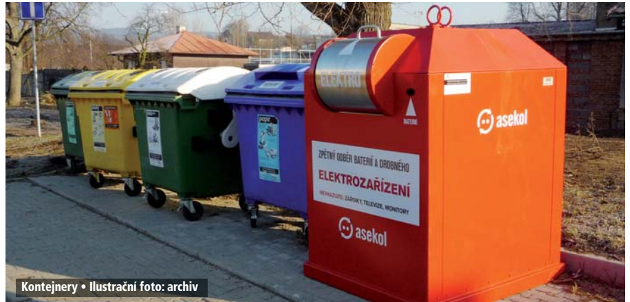
Kontejnery • Ilustrační foto: archiv

• zelené víko, TMAVÉ SKLO: 1 x 14 dnů – sudý týden v pátek. VS