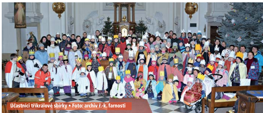
Účastníci tříkrálové sbírky