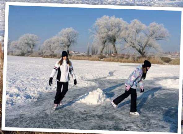
Zimní radovánky