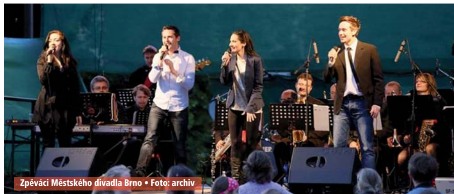
Zpěváci Městského divadla Brno

v informačním centru na Palackého náměstí 1 za cenu 250 Kč. Na místě budou pak vstupenky k dostání za cenu 280 Kč. ZS-A