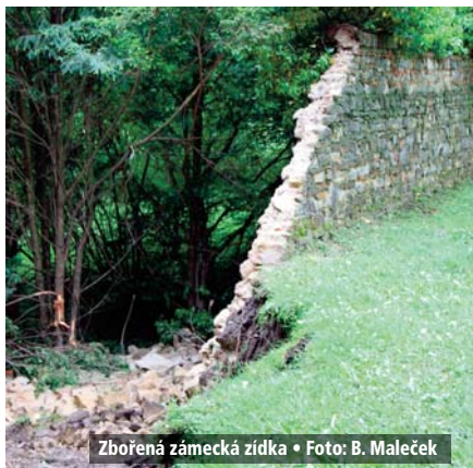
Zbořená zámecká zídka