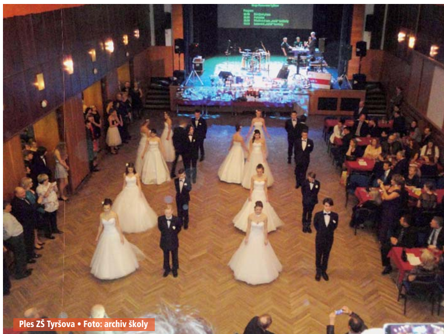
Ples ZŠ Tyršova