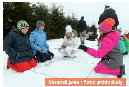
Nezmrzli jsme • Foto: archiv školy

Děti si samy uvědomovaly, že našly nové kamarády, s nimiž se na školních chodbách pouze