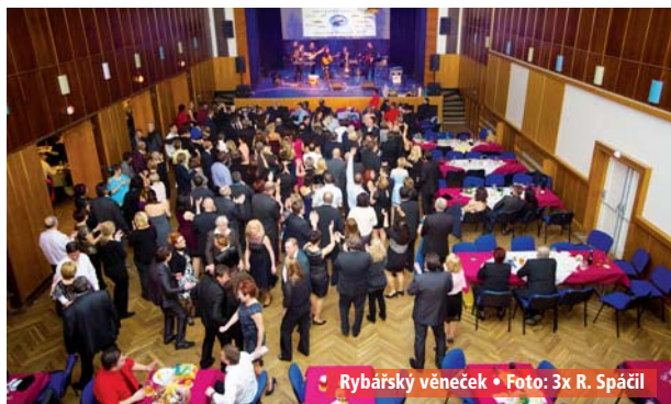
Rybářský věneček