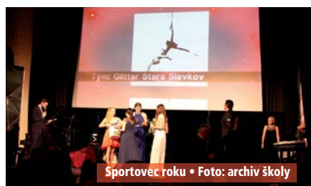
Sportovec roku