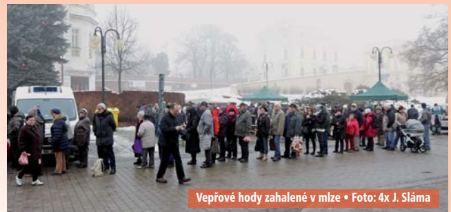
Vepřové hody zahalené v mlze