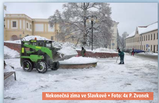
Nekonečná zima ve Slavkově