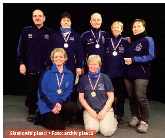
Slavkovští plavci •