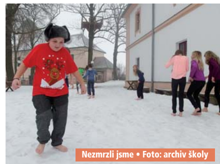
Nezmrzli jsme

míjely. Také zjistily, že „věrný přítel“ mobilní telefon není zase tolik důležitý, když se hrají hry s kamarády, soutěží se v ping-pongu a většina dne se tráví venku. Pět dní s partou kamarádů mimo svoje domovy je zážitek, na který se nezapomíná.