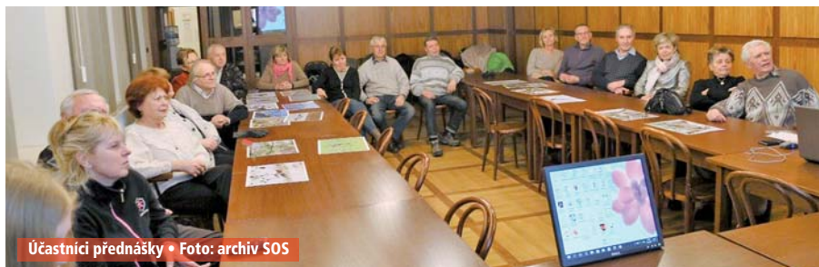
Účastníci přednášky