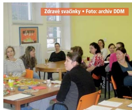
Zdravé svačinky

Od února jsme připravili na DDM Slavkov u Brna s paní Kateřinou Dvořákovou hudební blok s písničkami a pohybem pro nejmenší děti. V úterý od 10 hod. je program věnovaný dětem od 2 let. Je sestaven ze dvou částí hudební a tvořivé. V pátek od 9 hod. se lektorka věnuje dětem od 8 měsíců. Poté následuje od 9.30 hod. klasický baby klub bez programu. Platba se provádí za jednotlivé vstupy 40 Kč. Přihlášky vyplňovat nemusíte, stačí jen přijít a užít si s dětmi zábavné dopoledne. DDM