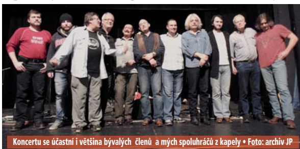
Koncertu se účastní i většina bývalých členů a mých spoluhráčů z kapely

PS: Ještě něco málo čísel. Poutníci natočili a vydali celkem 14 LP a CD. Odehráli do konce loňského roku 4202 koncertů a navštívili 6 států Evropy. Skoro u všeho jsem byl.