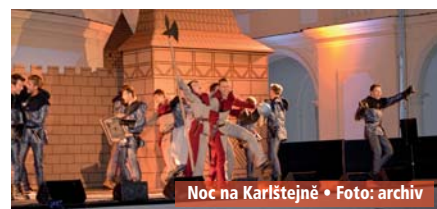
Noc na Karlštejně

Druhý zářijový víkend rozezná slavkovské nádvoří slavné muzikálové tituly v podání Městského divadla v Brně. V pátek 8. a sobotu 9. září se můžete těšit na My fair lady ze Zelňáku a Noc na Karlštejně. Předprodej vstupenek začne v průběhu měsíce března v Informačním centru na Palackého náměstí 1. ZS-A