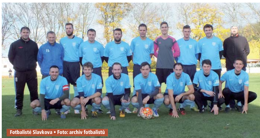
Fotbalisté Slavkova

Povedenými výkony na obou závodech si tak Marek zajistil titul přeborníka Jihomoravského kraje. Gratulujeme. trénéri