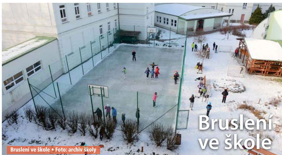
Bruslení ve škole