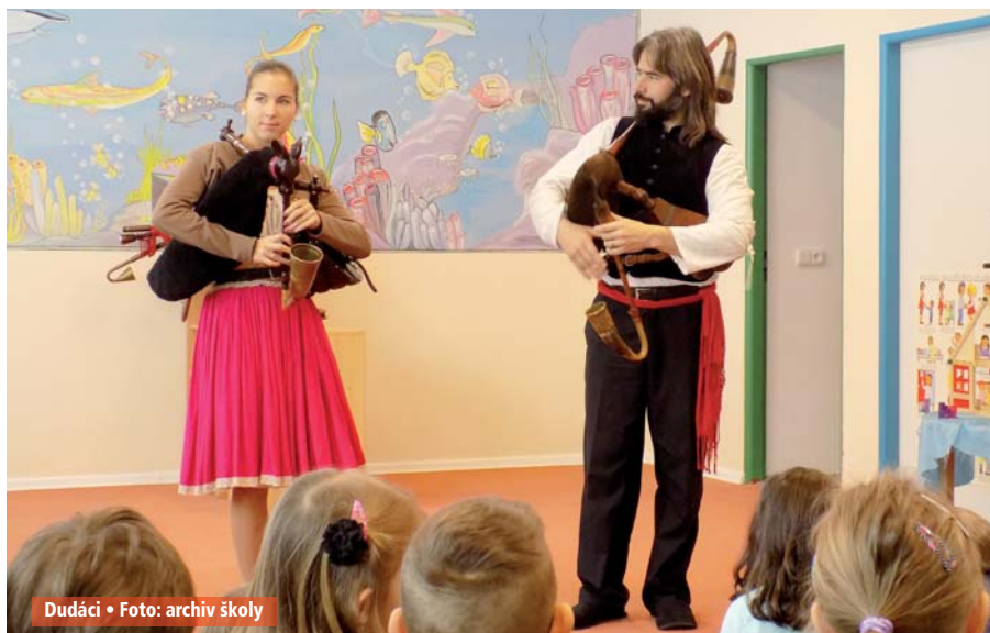
Dudáci