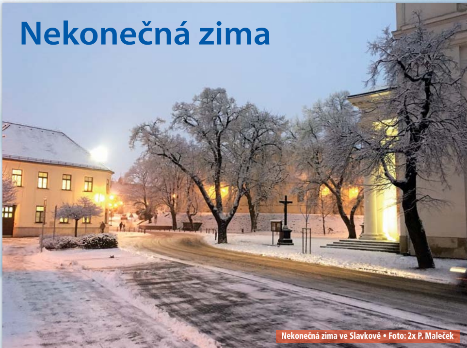
Nekonečná zima ve Slavkově • Foto: 2x P. Maleček