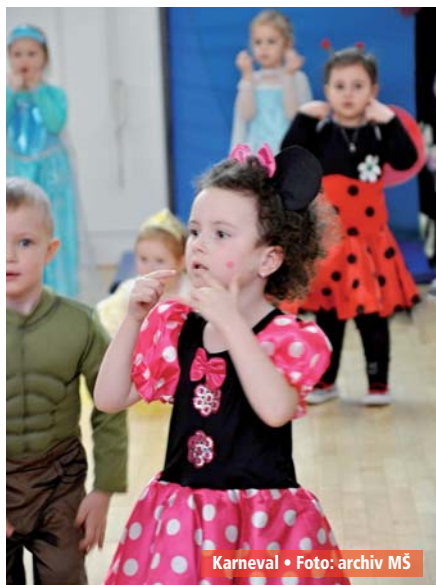
Karneval