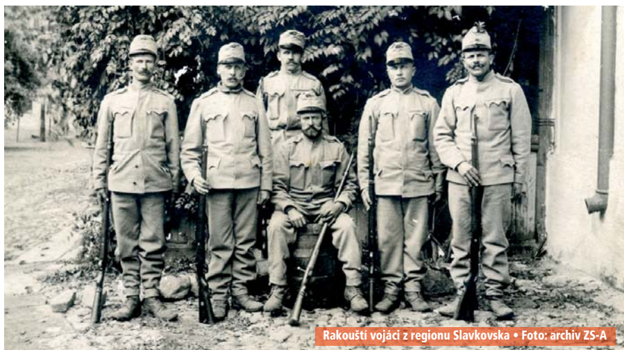
Rakouští vojáci z regionu Slavkovska