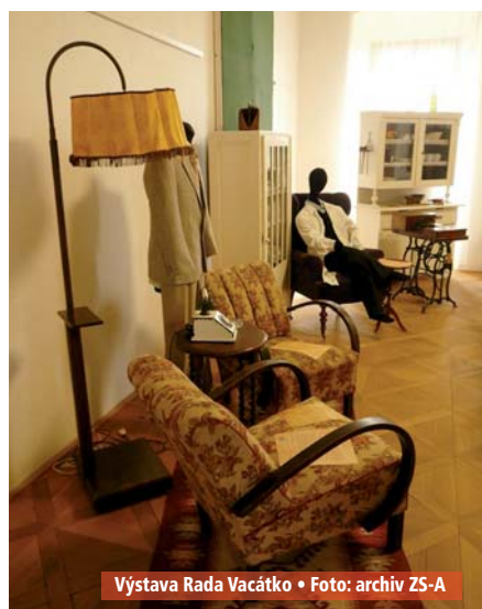
Výstava Rada Vacátko