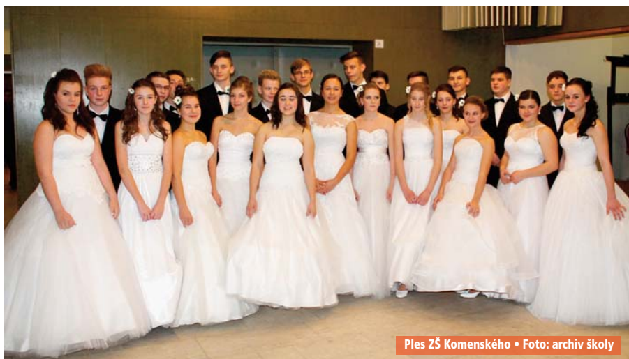
Ples ZŠ Komenského •