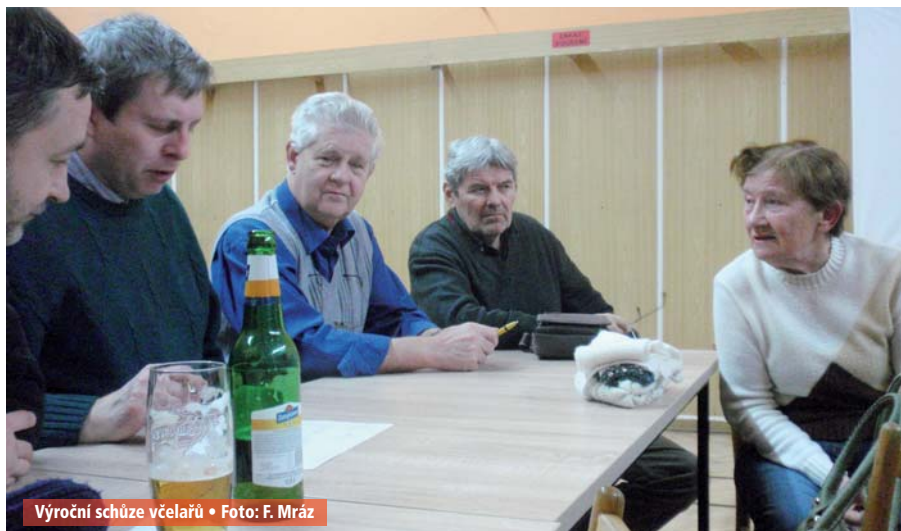
Výroční schůze včelařů

Místní organizace ČZS ve Vážanech nad Litavou pořádá v sobotu 25. března v 16 h. v sále Obecní hospody 16. ročník košty slivovice. Vaše vzorky pálenky přijímá od 4. do 10. 3. pan Vít Zachoval, Vážany nad Litavou č. p. 63. Hudba a občerstvení. Za hojnost Vašich vzorků děkují a na Vaši účast se těší zahrádkáři