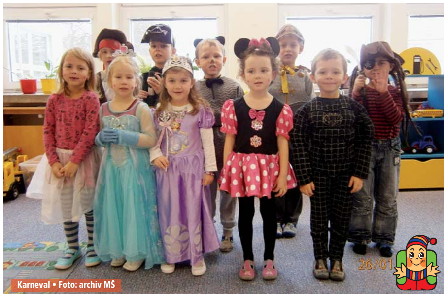
Karneval • Foto: archiv MŠ