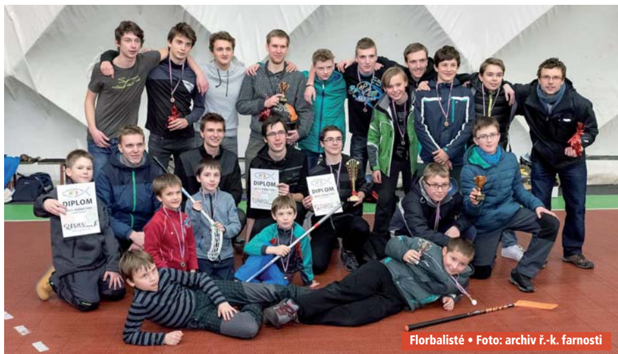
Florbalisté • Foto: archiv ř.-k. farnosti