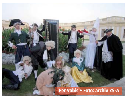
Per Vobis