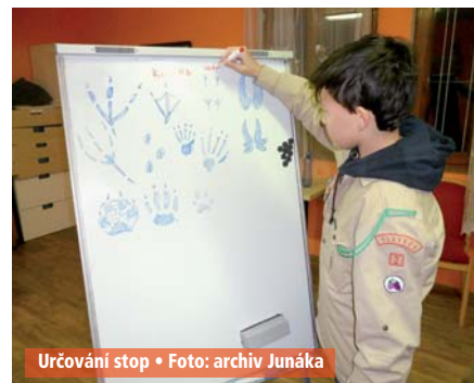
Určování stop

Komedie čerpá z poetiky čarovné májové noci, kdy je vše dovoleno. Sen noci svatojánské je hýřivým kolotem citů, her a bláznovství. Dva milenecké páry prožívají opojení svou neaplňenou láskou. Střetávají se s nepochopením a hrozbou trestu ze strany rodičů. Ve městě se připravuje svatba Vévody s krásnou Hipolitou a v lese se střetávají Oberon se svou manželkou Titánií. Neposedný Puk poplete, co může. Na palouku připravují řemeslníci svou „tragickou komedii“ o lásce rytíře Pyrama a jeho Thisbinky. „Komedie k popukání a přezalostná fraška“ nás přivádí ku konci hry. Vše se končí smírem. SO