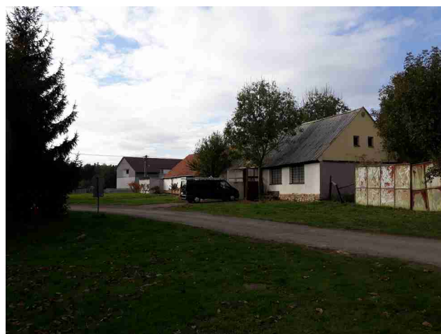
Pohled od západu a západní část řešeného území