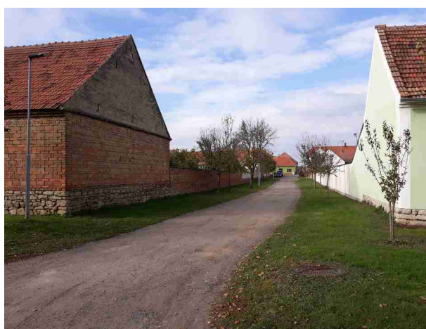
Východní okraj řešeného území, místní komunikace, pohled směrem k napojení na silnici II/416