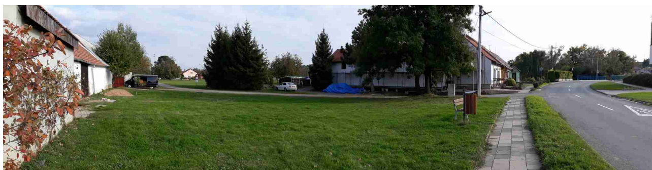
Západní okraj řešeného území, pohled od západu