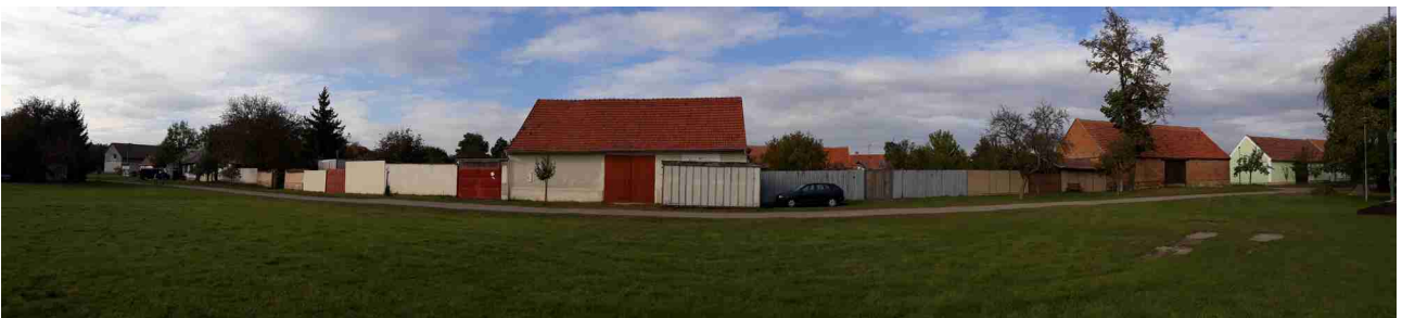
Celkový pohled od jihu, stávající stav