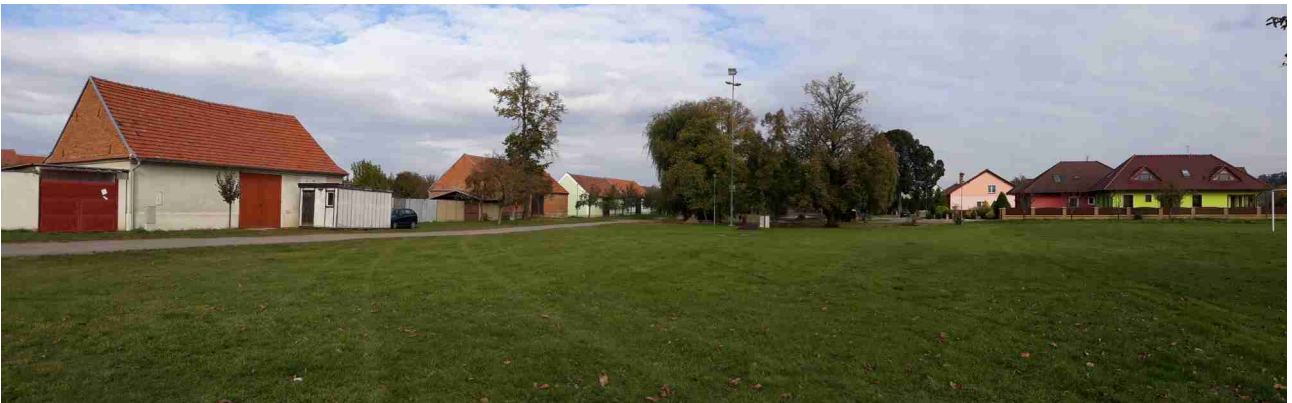
Východní část řešeného území s veřejným prostranstvím, pohled od západu