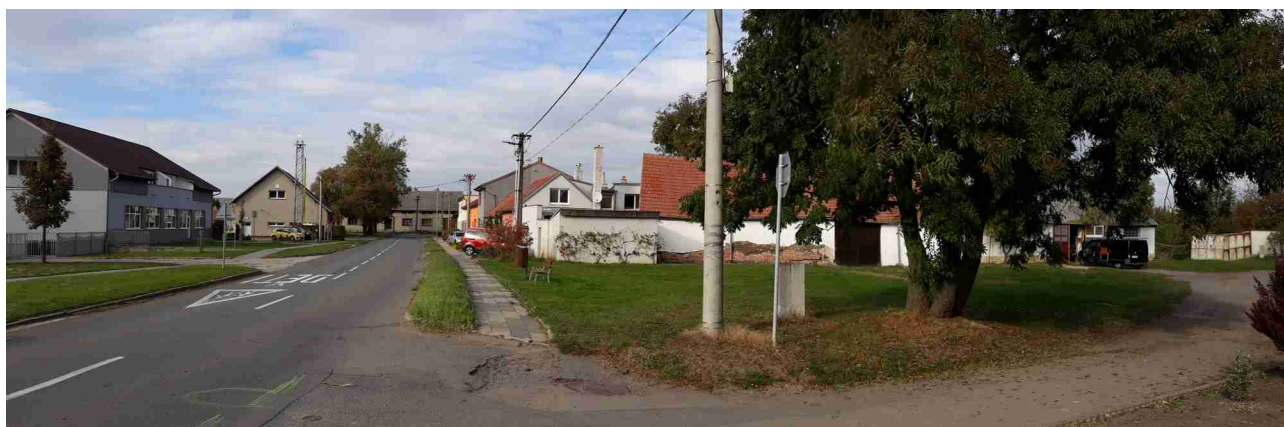
Západní část řešeného území s napojením na silnici II/416, pohled od jihu