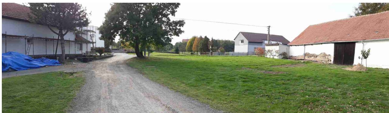
Západní část řešeného území, pohled od východu