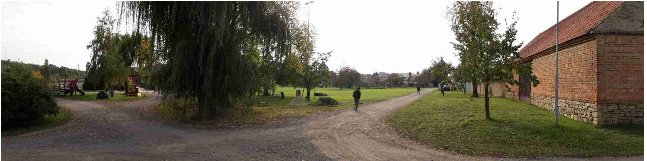
Pohled od východu