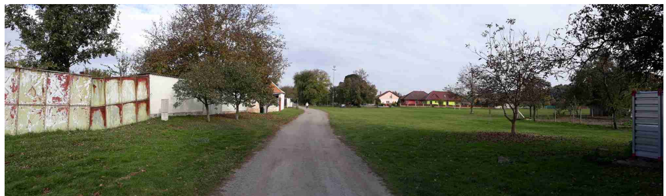
Stávající místní komunikace v řešeném území, pohled od západu